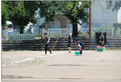
戸倉上山田地区スポーツエリアの候補地域である戸倉体育館周辺

正に千曲市を愛し、誇りに思いたい市民の意見だ。人とのつながり・交流による議論と真摯な行動がこれからの千曲市づくりの基本。これからの展開が楽しみである。