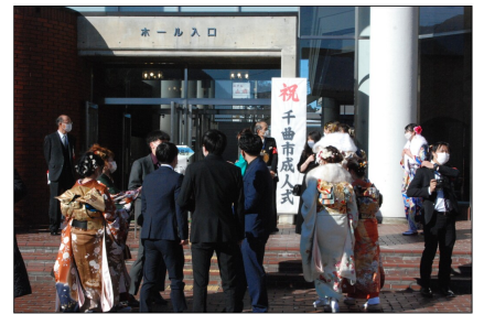
今年度の千曲市成人式出席者は469名

交歓会を2年ぶりに開催。8日・ 9日の両日は令和3年度千曲市成 人式が上山田文化会館で開催され た。成人式の開催は令和元年度以 来。式は小学校区ごとに二日間に 分割して実施。会場内では座席の 間隔を空け、恒例の成人の集いは 中止するなど感染症対策が施され たほか、新成人には新型コロナの 抗原検査キットも配布された。 出席した新成人からは「コロナ 禍でオミクロン株もあるなか、式 を開いてくれたことに感謝してい ます」という声が多く聞かれた。