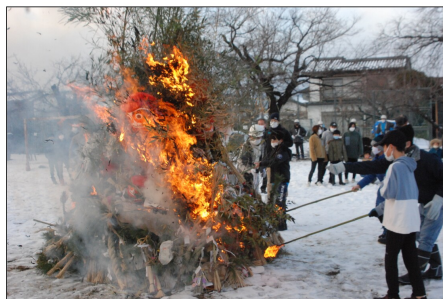
どんど焼きの様子（1月16日・屋代1区）

分追儺祭や、上山田の善光寺大本願別院・城泉山観音寺での節分会の中止が決定している。