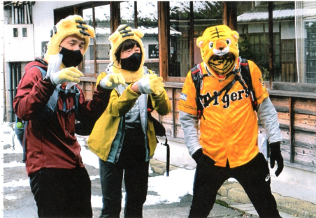
参加はソロ（単独）でもグループでも可

今回は千曲市内全域の名所旧跡や飲食店など36のチェックポイントを設定。自由にポイントを回ってスピードと得点を競い合うというもの。 レースは午前10時にスタート。雪と氷が路面を覆うなか、渡された地図とチェックポイントの案内を頼りにしながら、5時間の制限時間内に市内を回った。参加者はチェックポイントに到達した証拠として写真を撮影する。また特別ルールでJR、しなの鉄道やバスの利用が可能。巡回中に特定の運営スタッフに遭遇すると得点が増減するルールもあり、駆け引きも勝負の分かれ目となった。