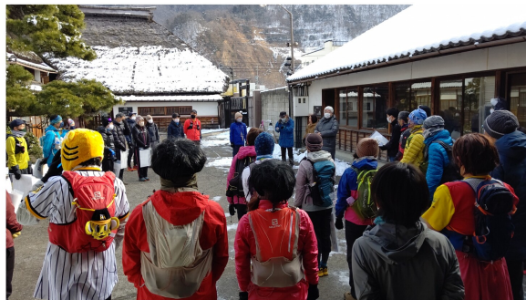
発着地点となったのは戸倉の坂井銘醸

地図をもとに制限時間内にチェックポイントを徒歩で回り、得点を集めるスポーツ「ロゲイニング」。須坂や松代でも大会が開かれるなど、近年県内でも人気を集め始めている。1月15日に千曲市内を舞台にロゲイニングのイベントが開催された。