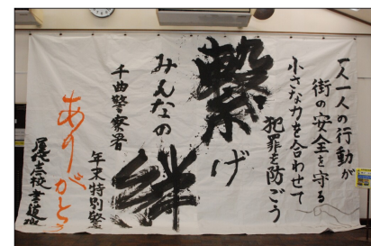
屋代高校書道班の作品（約4m×6m）