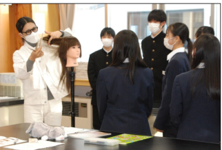
実演に見入る生徒たち

はスライドを上映して、通常の業務を紹介。ほかの講師たちも手作りの資料を使いながら現在の仕事の状況や、業界を取り巻く社会環境などについてわかりやすく説明していた。