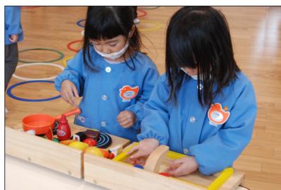
贈呈された玩具で遊ぶ園児ら（あんずの里保育園 1月18日）

あんずの里保育園は雨宮の雨宮保育園と森のあんず保育園を統合する市の整備計画により誕生した保育園。3年前の台風災害で雨宮保育園が被災したため、一足早くあんず保育園と統合され、あんず雨宮保育園に改称。両園の園児たちが一緒に過ごしていた。