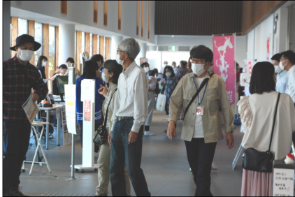
まちづくり文化祭（市役所ギャラリー 2021年10月11日）