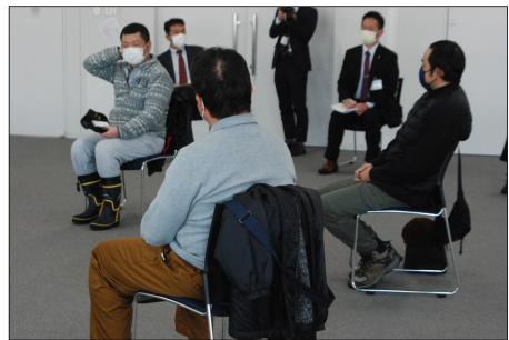
お出かけシェアトーク（1月15日・市役所301会議室）

市民と市長が自由な雰囲気の中で意見交換を行う「お出かけシェアトーク」。第7回は5名の若手営農者との対話の席が設けられた。1月15日のトークに参加したのは市内在住の30代・40代の農家で、あみず、ブドウ、花き、畑作などそれぞれの農業の現状や課題を語り合った。複数の参加者から後継者問題が大きな課題としてあげられ、品目によっては「今すぐに動かない」といった意見も出された。 また、保育園への温かい棚田米の提供や、空き家の作業場への活用などのアイデアも出て、市長も「有意義な提案をいただいた」と応じた。