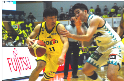
v s 京都ハンナリーズ戦（12月29日）

年内最終戦の千曲大会で京都を破り、連敗が9でストップした信州BW。徐々に故障者が復帰し反転攻勢ムードが高まってきた。元日からの強豪・千葉ジェッツとの二連戦は連敗でホームに戻ったが、8日からのホームゲームは対戦相手の広島に新型コロナウィルス感染者が発生。大会が中止となった（2月に代替試合）。