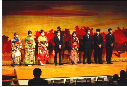
成人式・一日目（1月8日・上山田文化会館）

霊静山のふもとにある曹洞宗の禅寺・大雲寺。池の水面には四季折々の優雅な姿が映し出される。春には500本もの桜が咲き誇り、夏は一面の蓮の花、色鮮やかな秋の紅葉のほか冬の雪化粧もまた一段と美しい。