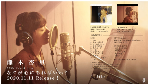
熊木杏里 12th New Album なにが心にあればいい？ 2020.11.11 Release!