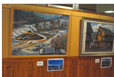
50号から60号サイズの大型作品も多数展示

稲荷山を中心とした地域の街並みを描いた作品は、それぞれ現在の同じ場所を撮影した写真も展示され、移り変わりを比べることが出来るようになっている。更埴西中学校および更埴西図書館から入場可。観覧時間は9時から16時。3月16日まで開催。