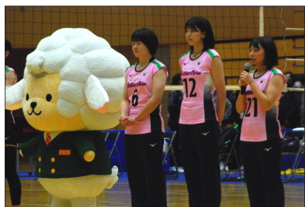
試合前に内定3選手の紹介も行われた

翌週は山形県での上位対決。2位のアマンマレ、首位の群馬銀行との二連戦は二日連続でフルセットの激闘に。両試合とも2セット奪われてからの大逆転勝利で勝利をもち取った。これによりブリリアントアリーズは通算成績10勝2敗となり一気に首位に浮上。3月に行われるファイナルステージ出場に大きく近づいた（上位4チームが進出）。