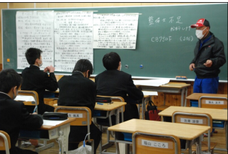
職業講演会の様子

また、大手美容室の美容師の講義では最後に生徒たちにカツティングの体験と実演の時間も設けられた。講師らは仕事に取り組むうえで心の