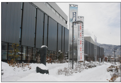
平野部でも10cm以上の積雪に（千曲市役所前）

成人式は2日間に分け開催 一方、警戒レベルの引き上げ前 には、式典などの再開の動きも出 ていた。千曲商工会議所では賀詞